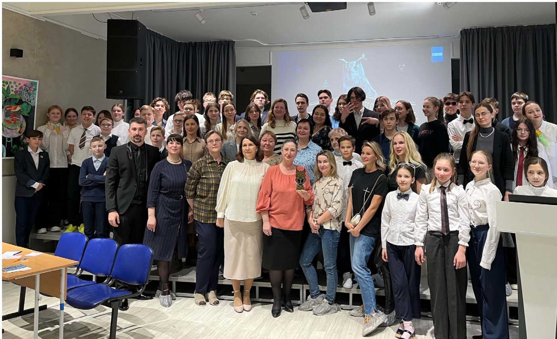
МАОУ «Лицей № 67 г. Челябинска»